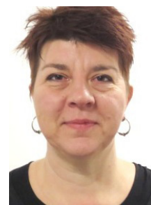
Af Merete Djurhuus Forebyggelsessekretariatet