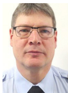
Af Axel Ahm Forebyggelsessekretariatet

Efter at samfundet har været lukket ned i længere tid på grund af Covid-19, ser det nu ud til, at der er lys for enden af tunnelen.