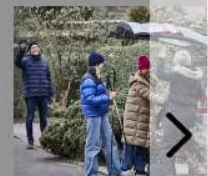
Naboven: Mere feriehjælp