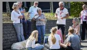
Naboven: Flere nabohjælpere