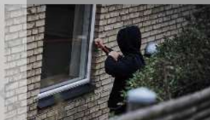
Naboven: Indbrud i nabolaget