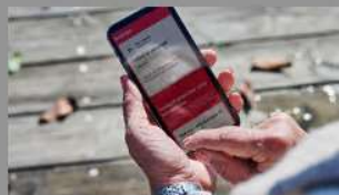
Naboven: Flere advarsler